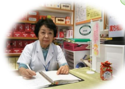
子宝相談を受けながら、相談機の傍に円ブリオ基金箱を設置。快く協力下さっています。