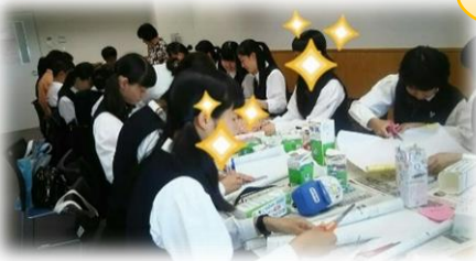
佐賀のいのちの講演会の準備に向け基金箱づくり

「いのちの講演会」でお配りする「円ブリオ基金箱」作成ボランティアに、14名の高校生、大学生等4名の皆さんが参加。「一人でも多くの赤ちゃんが助かりますように」と願いを込めて作りました。など、感想も語ってくれました。大学生は、昨年基金箱作りや講演会の運営にも参加し、手際よく作成。いのちのバトンが繋がっているようで、嬉しかったです。（佐賀FBより）