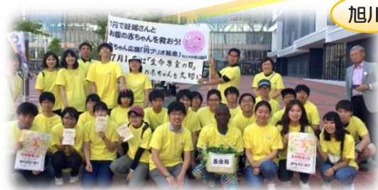
旭川駅前、大学生 29 名も参加。

今年も博多駅前でも円ブリオ募金活動をしました。大雨警報が解除され、予定通り行えましたが、スマホ歩きで無視されたり、チラシ配りも大変になってきた感じです。でも中には戻って来て寄付して下さいたり、昨年より多く集まり、皆様の暖かいお心に感謝です。(福岡県いのちを守る会)