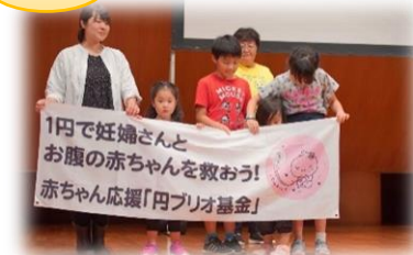
講演会のステージの上で活動紹介