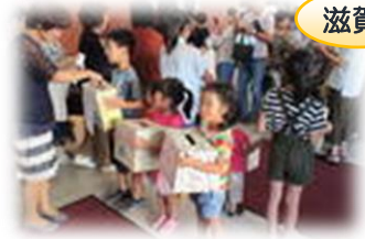
講演会会場のフロアで呼びかけ